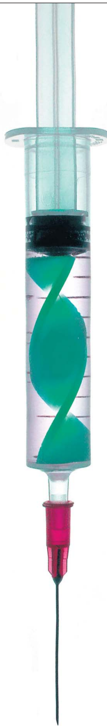
Neue Therapien zu entwickeln braucht Zeit. Pharmakonzern haben nicht immer die Geduld.